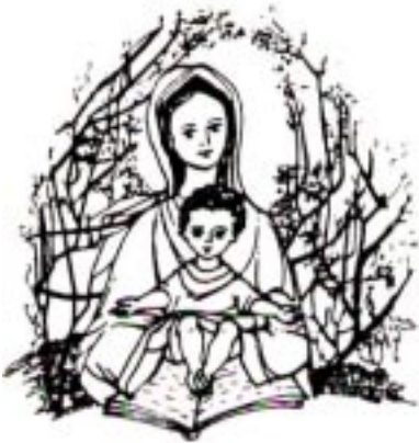
Notre Dame Nuestra Señora

"Madre de los pobres, de los peregrinos, te pedimos por América Latina".